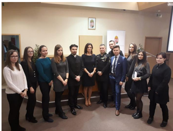
Csoportkép a Miskolci Jogi Kar jogászösztöndíjasairól az IM Nemzeti Kiválósági Jogászösztöndíjasok Szakmai Napján Dr. Varga Judit igazságügyi miniszter asszonnal. (2019. december 4.)

Az ösztöndíjak mellett az Igazságügyi Minisztérium tematikus szakmai rendezvényeket is szervez az IM Nemzeti Kiválósági Ösztöndíj-programban részt vevő joghallgatók számára.